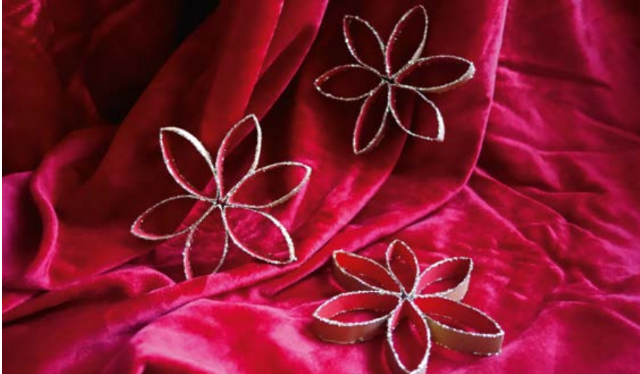
Glitzernde Sterne zieren die Treppenhäuser.