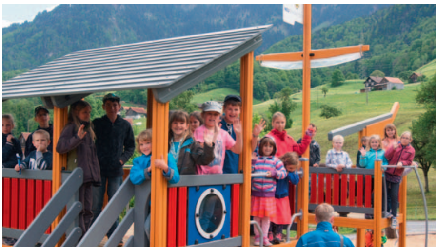
Schiff ahoi! Kinder winken den Müttern ein DANKE zu und nutzen das multifunktionale Kletterschiff gut aus.