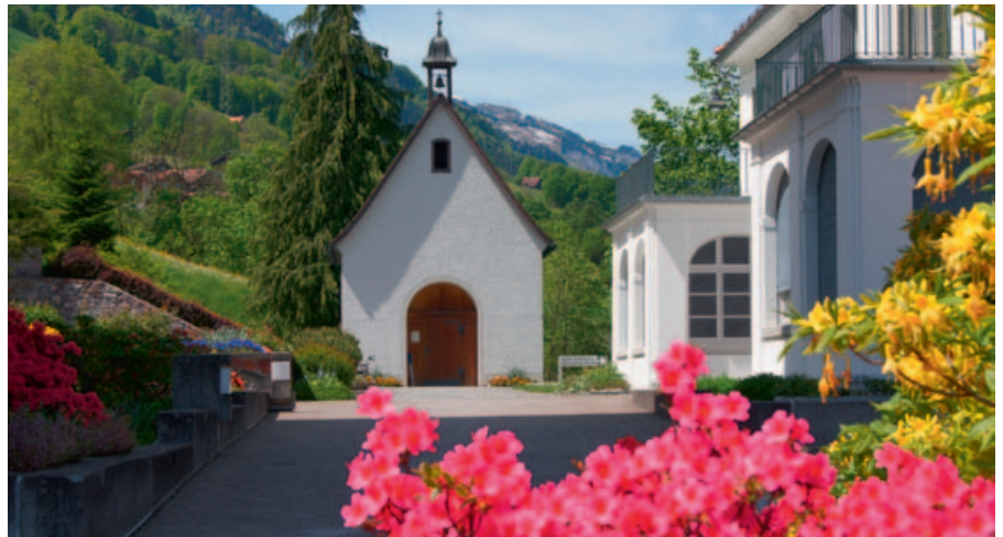
Der Sommer kündigt sich an.

Heute gibt es in Burundi und den Ländern der Grossen Seen Hunderte von Gruppen der Jugend- und Erwachsenengemeinschaften Schönstatts, die Kampagne der Pilgernden Gottesmutter mit über 5000 Bildern, eine starke Pilgerbewegung und zahlreiche apostolische Projekte.